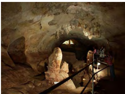
Die Schauhöhle Ghar Dalam: